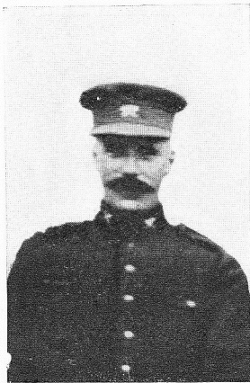
BASYN, Gustave , né le 7 juin 1884, à Anvers. Sous-Lieutenant T. A. C. Ordre de Léopold; Croix de Guerre. Interné en Hollande, réussit à s'évader et à rejoindre le front belge, où il se distingua en plusieurs circonstances; mourut le 18 novembre 1918, à l'hôpital militaire de Cabour (Adinkerke).